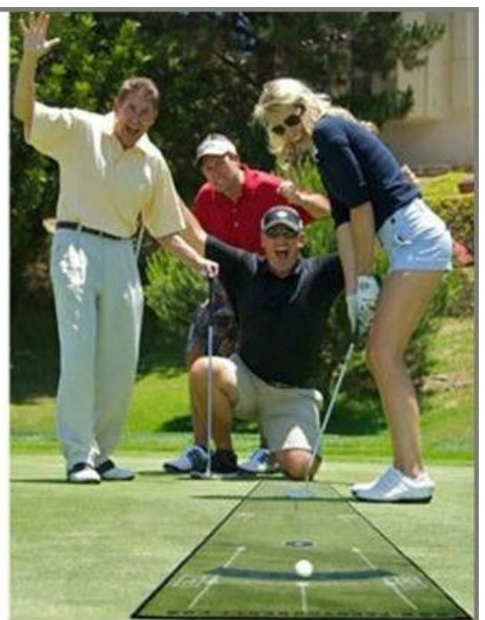
Whenever, wherever !