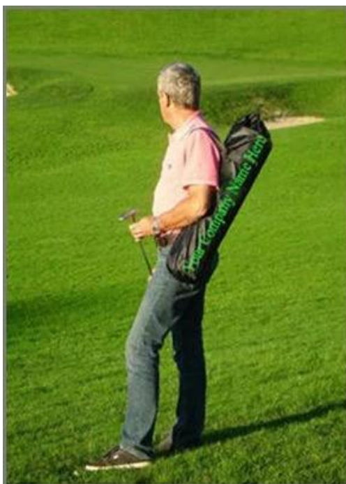
Easy to carry, easy to use !

Einzelne Beutel-Verpackung: Einfach zu tragen.