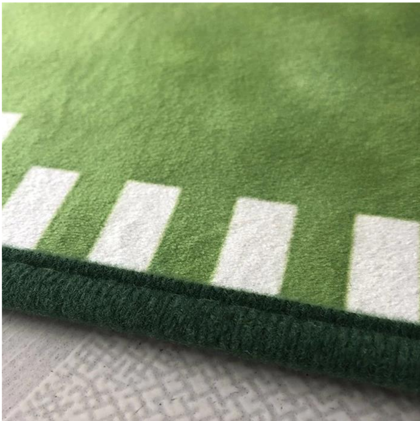
Antiship Design Felt Backing mantiene la colchoneta estricta en el suelo