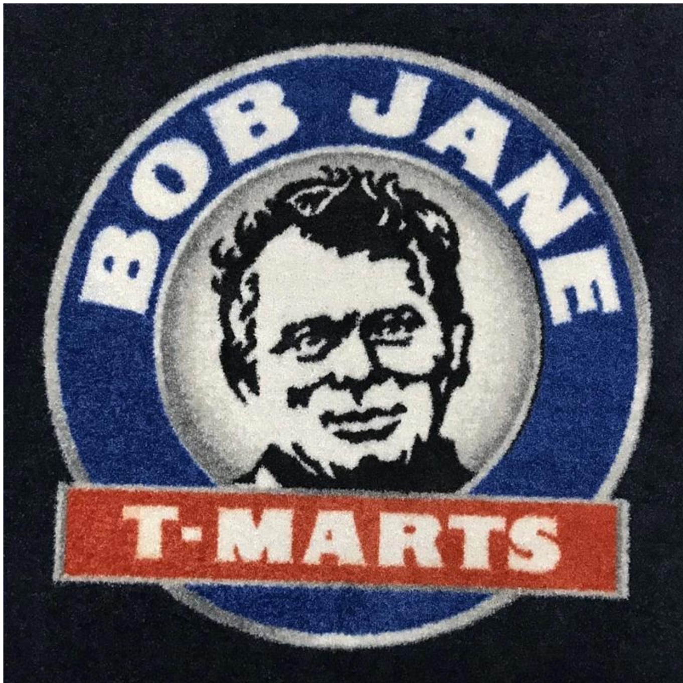
Image de référence pour 4mm Nylon Pile