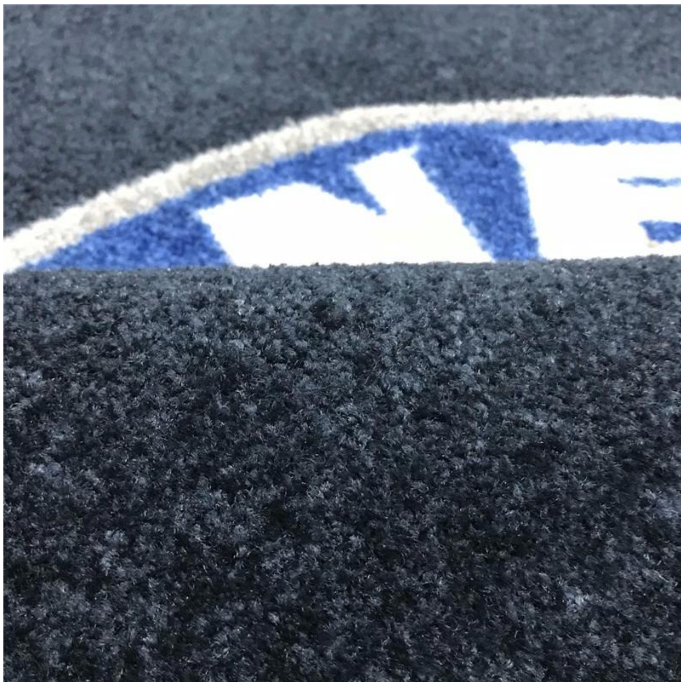
Images de référence pour le support en caoutchouc de 2mm