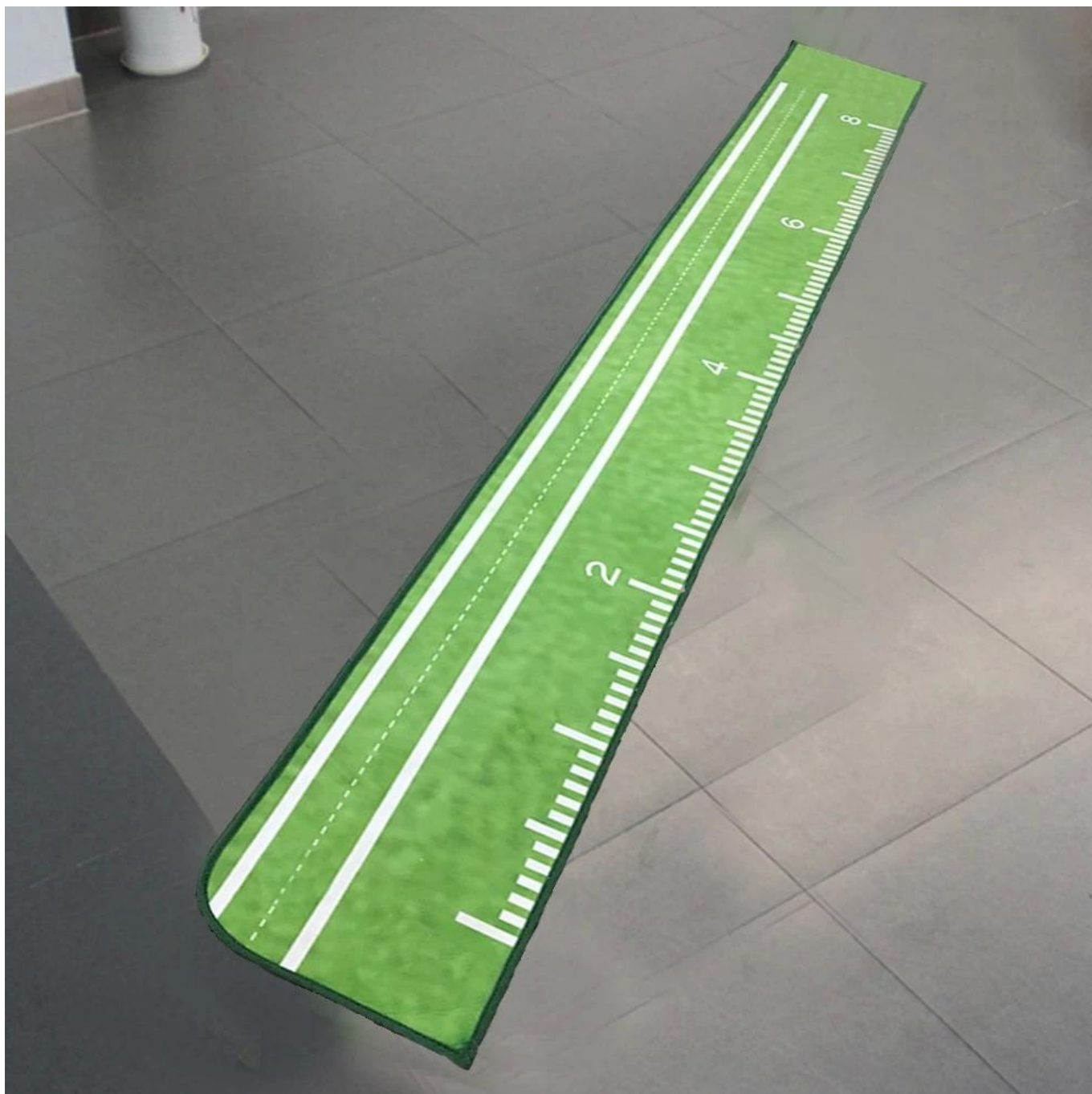
Pile de polyester douce et lisse: améliore l'expérience de putting