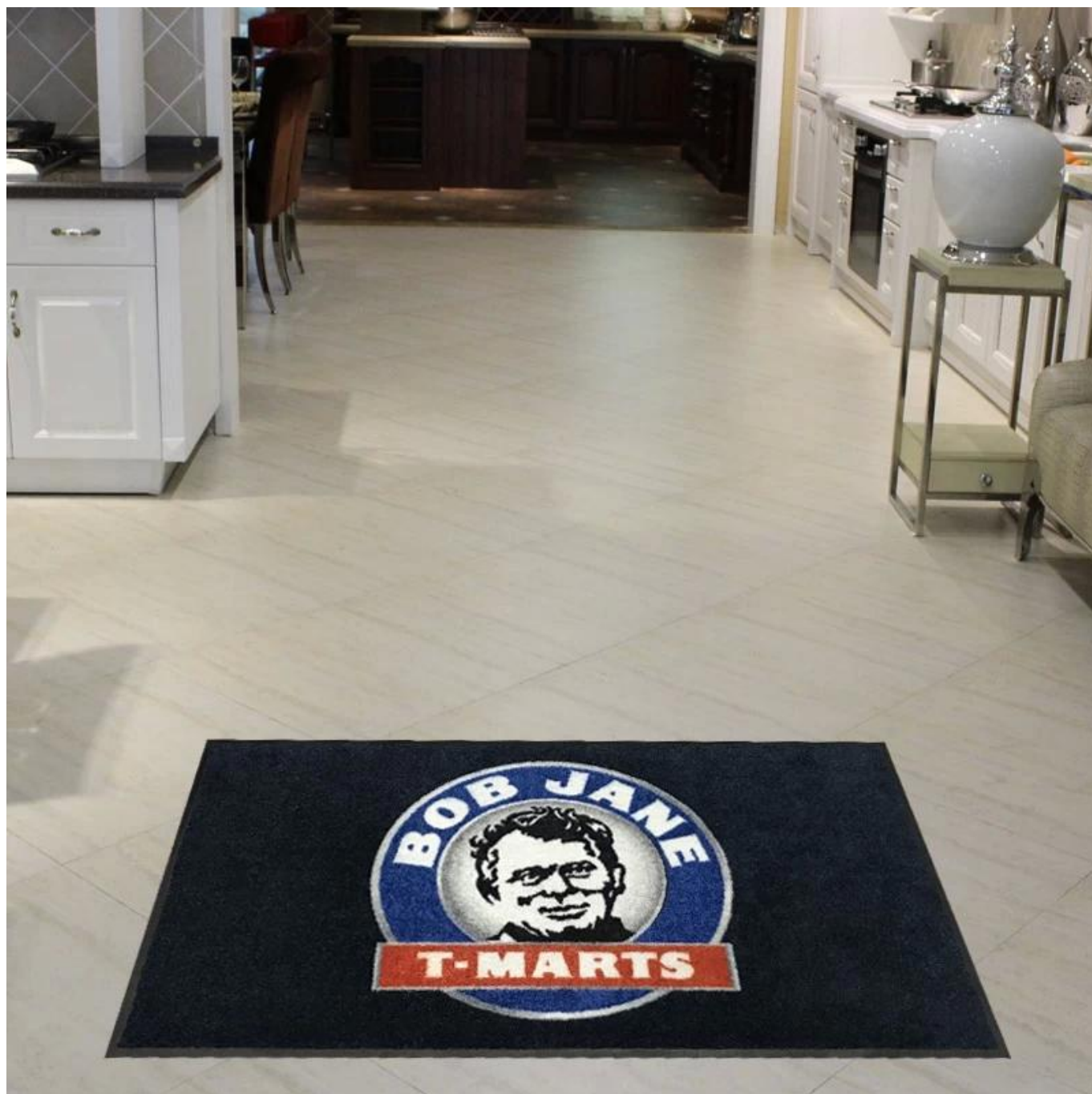
Imagem de referência para impressão