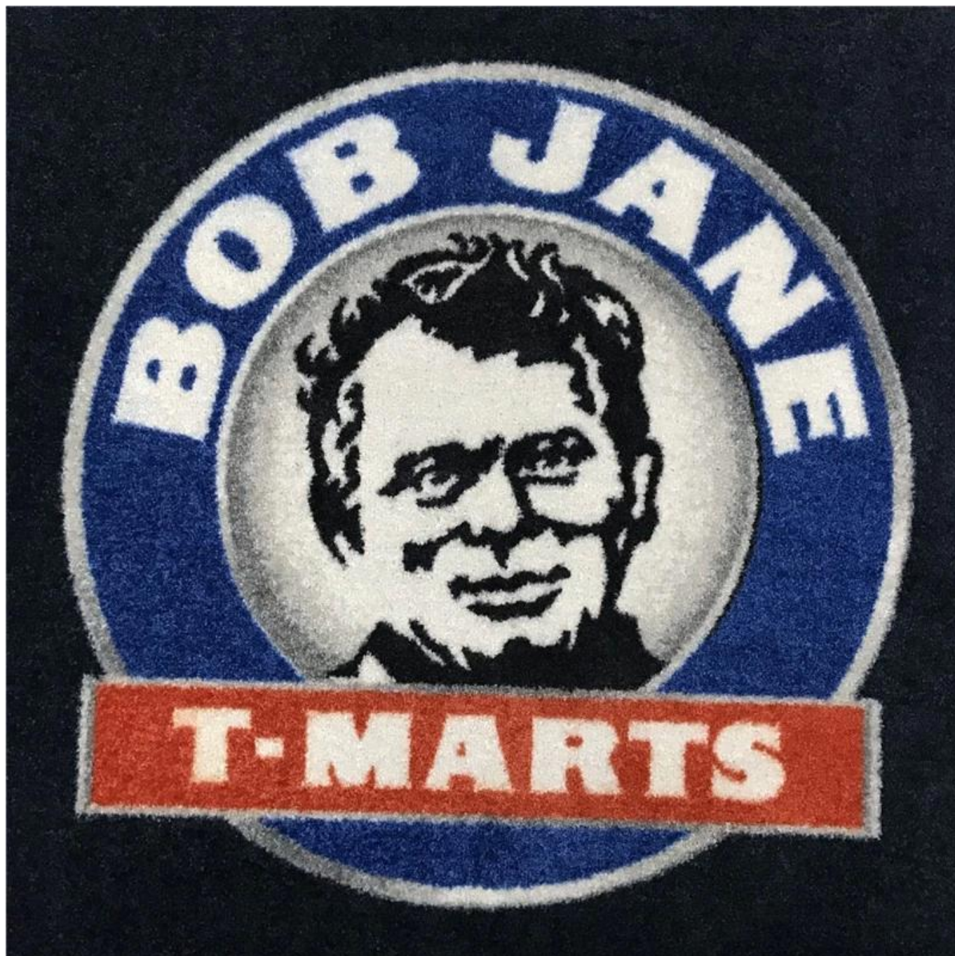
Imagem da referência para a pilha de nylon de 4mm