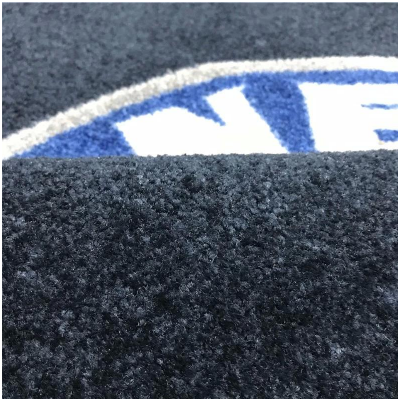
Справочные фотографии для 2 мм резиновой подложки