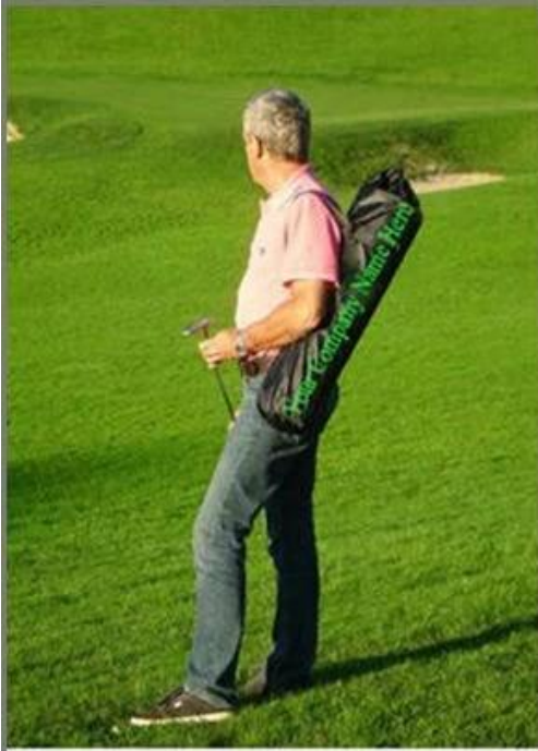
Easy to carry, easy to use !