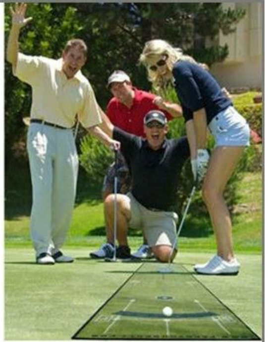
Whenever, wherever !